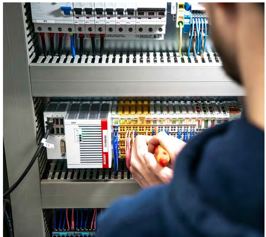
Montage und Verdrahtung der mit WSCAD konstruierten Schaltschränke erfolgen bei ISAR Aerospace aus Qualitätssicherungsgründen intern.