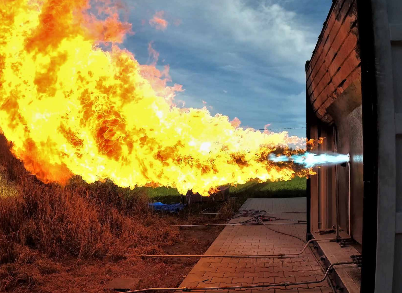
Die Schaltschränke sind Bestandteil der Teststände – beispielsweise für Komponententests wie hier am Standort Reischach.

Die WSCAD gehört zur Buhl Unternehmensgruppe mit 700 Mitarbeitern und ist seit drei Jahrzehnten auf die Entwicklung von E-CAD-Lösungen spezialisiert. Zu den Kunden zählen mittelständische Unternehmen, internationale Konzerne sowie Planungs- und Ingenieurbüros. Über 35.000 Anwender aus den Branchen Maschinen- und Anlagenbau sowie aus der Gebäudeautomation und Installationstechnik arbeiten mit der integrativen WSCAD Software. Auf einer Plattform mit zentraler Datenbank vereint sie die sechs Disziplinen Elektrotechnik, Schaltschrankbau, Verfahrens- und Fluidtechnik, Gebäudeautomation und Elektroinstallation. Ein Komponententausch ist sofort in den Plänen aller Disziplinen vollzogen. Mechanismen für Standardisieren, Wiederverwenden und Automatisieren verkürzen die Zeiten für Planung und Konstruktion von mehreren Wochen bis auf wenige Stunden und Minuten bei höherer Qualität der Arbeitsergebnisse.