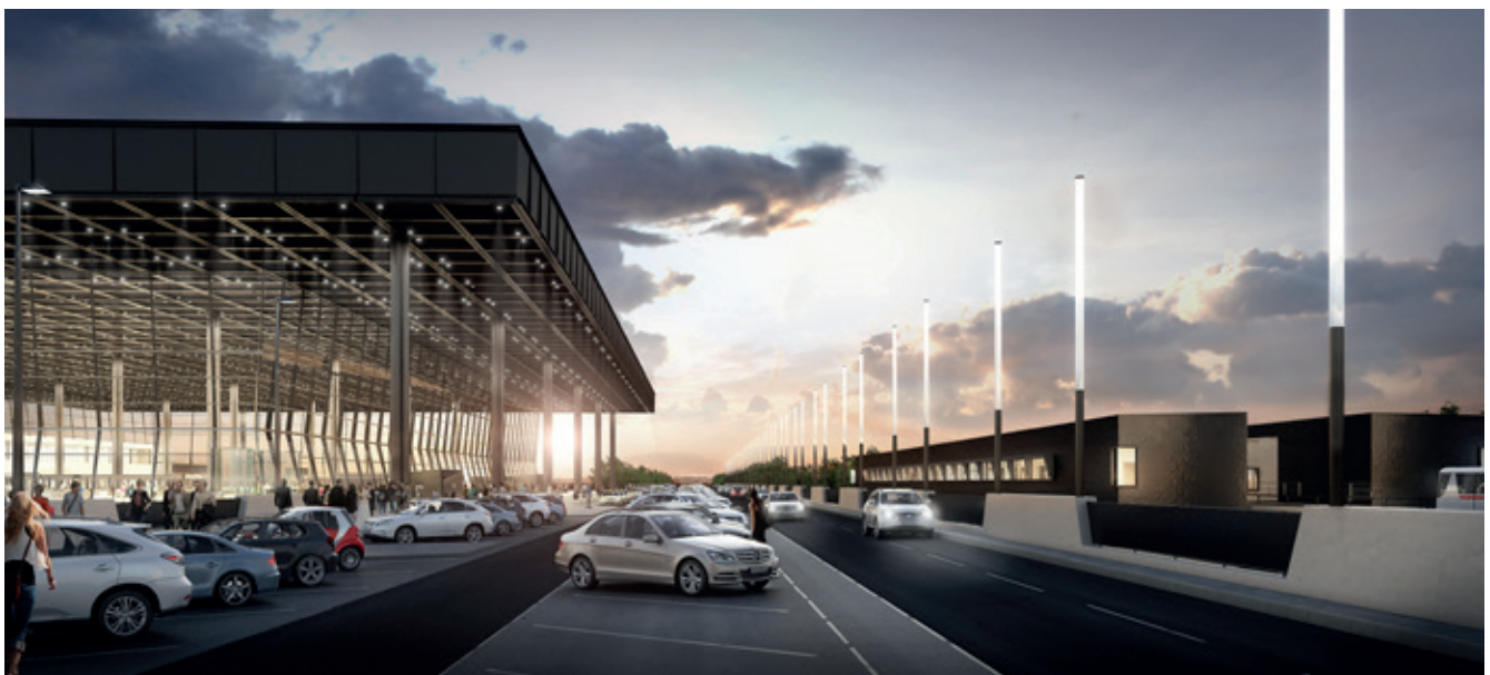
An- und Abfahrbereich des neuen Terminal 3 am Flughafen Frankfurt mit Station des Personen-Transport-Systems (PTS) im Hintergrund

tionen, die über redundante Steuerungen realisiert werden“, sagt Heike Frommhold von CANZLER. „Für die Planung setzen wir WSCAD auf Wunsch unseres Auftraggebers seit 2012 ein“, so Heike Frommhold. „Wir kannten dieses System für den Bereich Gebäudeautomation anfangs nicht, haben es aber schätzen gelernt, weil wir bereits nach kurzer Einarbeitungszeit schnell und effektiv damit arbeiten konnten“.