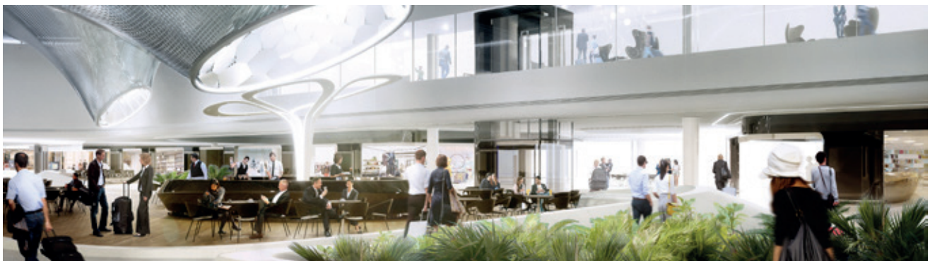
So soll in Kürze der Marktplatz des neuen Terminal 3 am Flughafen Frankfurt aussehen. Die Gebäudeautomation dafür wird mithilfe der E-CAD-Lösung von WSCAD geplant.

Dabei kann auch hinterlegt werden, welche lokalen Vorrangbedienelemente für einzelne Objekte vorzusehen sind. Diese Datenbank soll an die externen GA-Planer weitergegeben werden, womit alle dieselbe Grundlage haben. Das Ziel ist die schnelle Einhaltung der geforderten Standards bei höherer Qualität. „Wir haben noch viel vor uns“, meint Eckardt, „sind aber insgesamt und dank WSCAD auf einem guten und absolut in der Zeit liegenden Weg.“