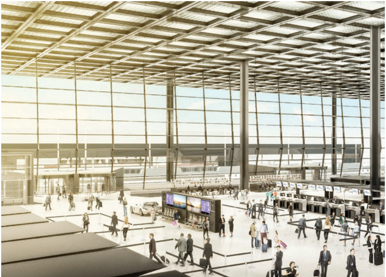
Die Gebäude- und Raumautomation der Check-in Halle des neuen Terminal 3 am Flughafen Frankfurt wird mit der E-CAD-Lösung von WSCAD geplant.

Die WSCAD GmbH gehört zur Buhl Unternehmensgruppe mit 800 Mitarbeitern und ist seit drei Jahrzehnten auf die Entwicklung von E-CAD-Lösungen spezialisiert. Zu den Kunden zählen mittelständische Unternehmen, internationale Konzerne sowie Planungs- und Ingenieurbüros. Über 40.000 Anwender aus den Branchen Maschinen- und Anlagenbau sowie aus der Gebäudeautomation und Installationstechnik arbeiten mit der integrativen WSCAD Software. Auf einer Plattform mit zentraler Datenbank vereint sie die sechs Disziplinen Elektrotechnik, Schaltschrankbau, Verfahrens- und Fluidtechnik, Gebäudeautomation und Elektroinstallation. Ein Komponententausch ist sofort in den Plänen aller Disziplinen vollzogen. Mechanismen für Standardisieren, Wiederverwenden und Automatisieren verkürzen die Zeiten für Planung und Konstruktion von mehreren Wochen bis auf wenige Stunden und Minuten bei höherer Qualität der Arbeitsergebnisse.