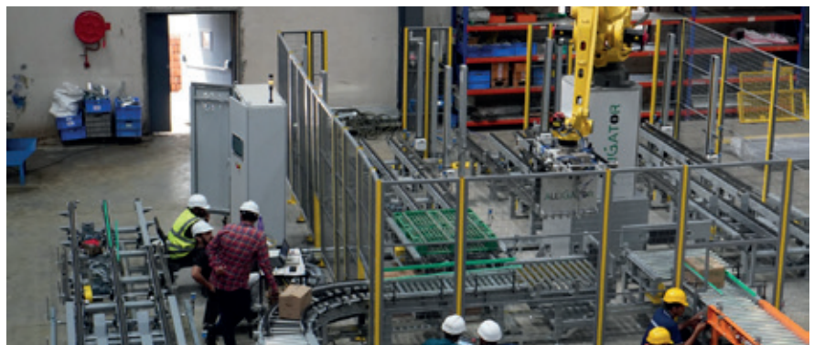
Inbetriebnahme bei Alligator Automations: auditsichere Dokumentation und weltweite Normkonformität als Qualitätsmerkmal.

Neben Verfahrenstechnik, Mechanik und Kinematik bildet die Elektrotechnik den zentralen Pfeiler der Automatisierungslösungen von Alligator Automations. Ein zehnköpfiges Planungsteam verantwortet sämtliche elektrotechnischen Aufgaben – von Energieverteilung und Lastmanagement über Antriebstechnik und Robotikintegration bis hin zu Stromlaufplanerstellung, Schaltschrankaufbau, Stücklisten, Materialfreigaben und technischer Abstimmung mit Kunden und Lieferanten. In diesem projektorientierten Umfeld mit hoher Variantenvielfalt bestimmt die Effizienz der E-CAD-Planung maßgeblich die Wirtschaftlichkeit und Termintreue.