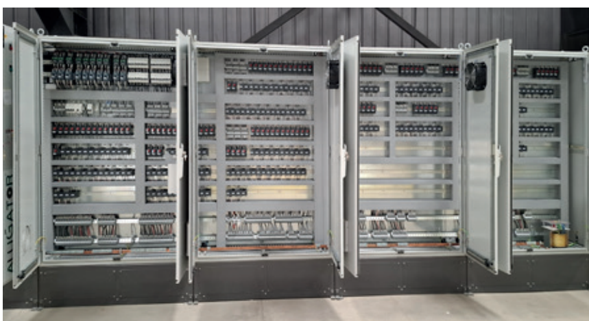
In ELECTRIX AI geplante und mit KI generierte Schaltschränke bei Alligator Automations: direkt vom digitalen Design in die hauseigene Fertigung und Prüfung.