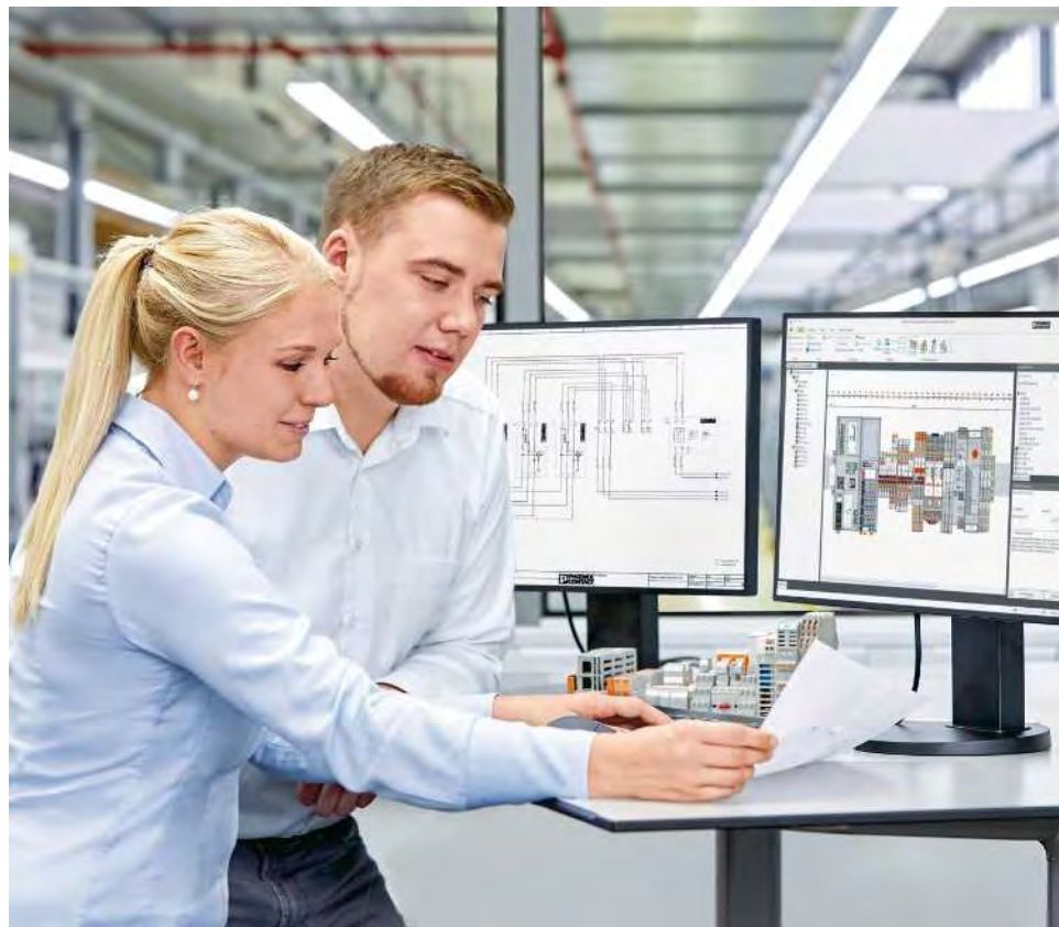
Perfekte und digitale Vernetzung aller Prozessschritte