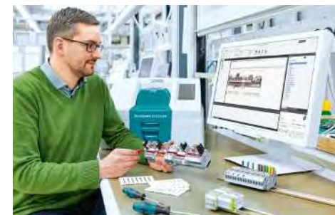
Digitale Fertigungsunterlage zur manuellen oder automatisierten Bestückung