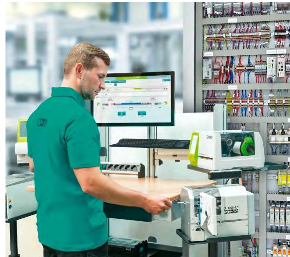
Effiziente Leiterverarbeitung bei maximaler Flexibilität im Produktionsumfeld