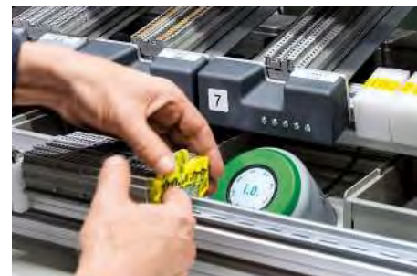
Ein Pick-by-Light-System unterstützt bei komplexen Montageaufgaben