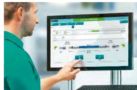
Software-gestützte, teilautomatisierte Leiterverarbeitung