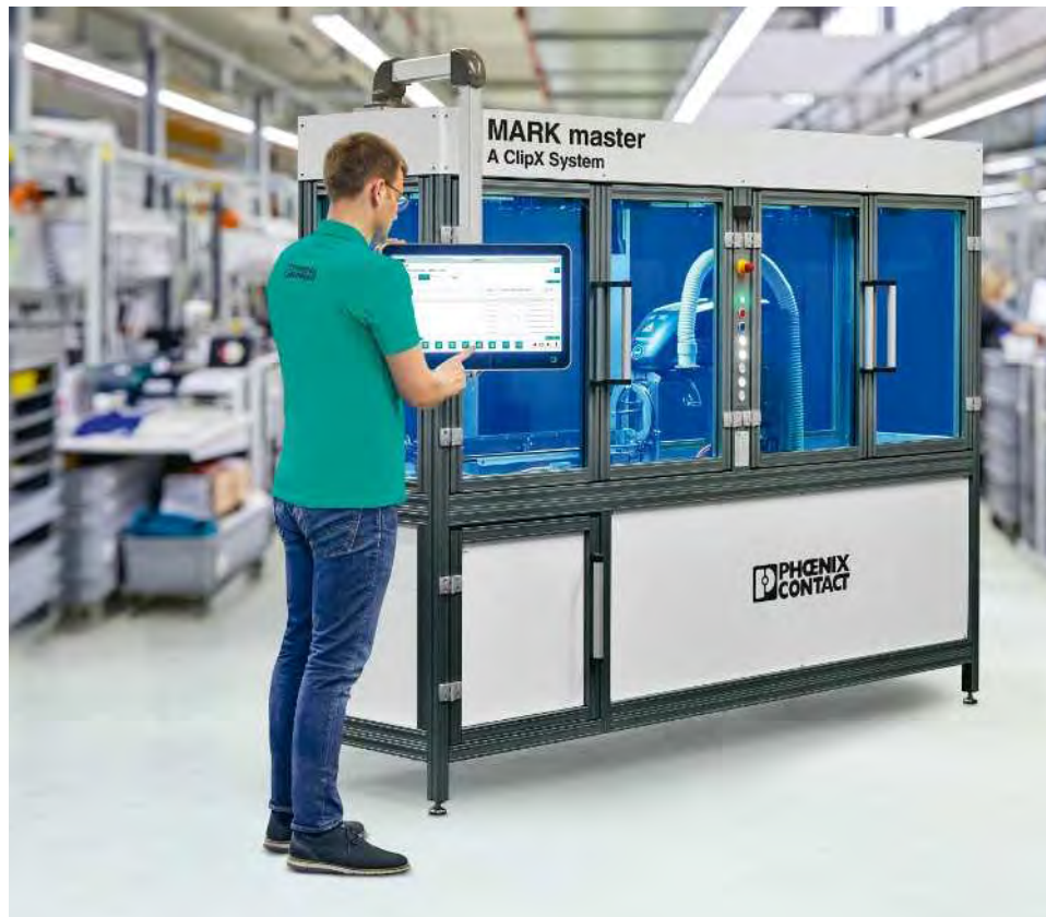
Schnelle und exakte Kennzeichnung bestückter Tragschienen