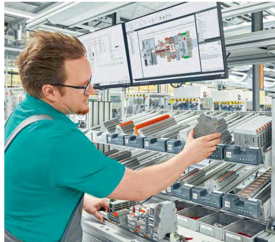
Datenbasierte und präzise Lenkung des Montageprozesses